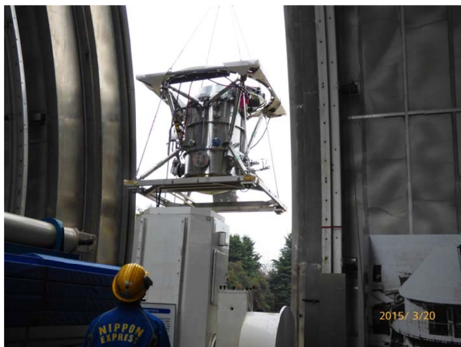
写真 7 天文機器資料館のドームスリットを開いての搬入

写真 7 はドームの中から見えた搬入の様子である。ドームスリットの開口は約 3.5m あるが CIAO の大きさは横幅 2.2m ほどあり、写真で見えるように余裕はあまりない。下すスペースがドーム内の東にあり、クレーンのワイヤーを開いたスリット扉ぎりぎりでも下せずワイヤーを斜めに引っ張って何とか床に下し、所定の位置までチルローラーを使って移動した。