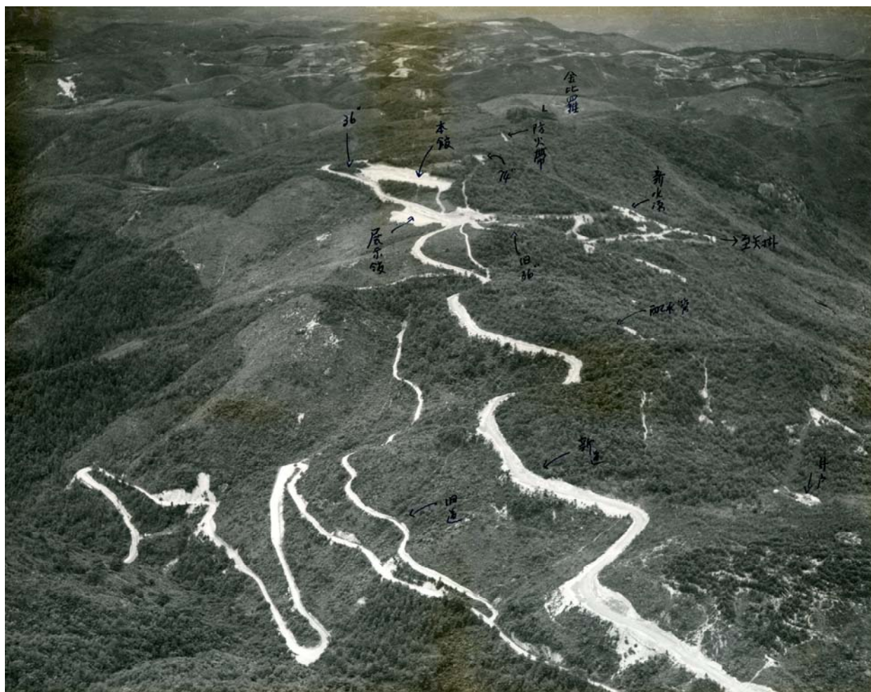
写真 1 天文台予定地の航空写真

写真 1 は、岡山天体物理観測所建設予定地付近を撮影した航空写真に文字入れをした写真であるが、この写真のままでは読めないので、写真 2 に文字入れした写真を掲載する。