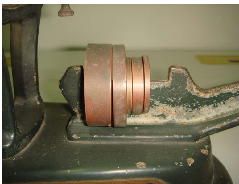
写真5 分銅置き場の分銅