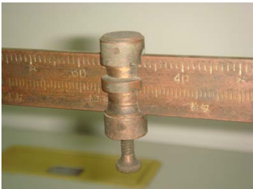
写真2 移動錘(重量読み取り)