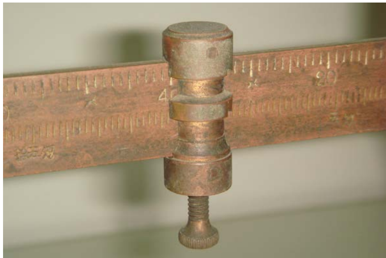
写真6 下のねじで移動錘は固定できる

「何でも屋」で量り売りをする際、分銅と目盛り錘の位置を決めておいて計る重さを固定して、砂糖などを小さなシャベルで増やしたり減らしたりできる目盛り錘（移動錘）を固定することもできる。写真6の移動錘の下に固定用ねじがついている。