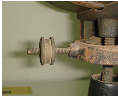
写真3 ゼロ点調整ねじ

計りたいものを写真1の右の皿にのせ、分銅を左の分銅載せに載せ、棹の部分のスライドする器具(移動錘)を左右に移動させ棹が水平になるところで移動錘の右端の目盛りを読むのである(写真2)。