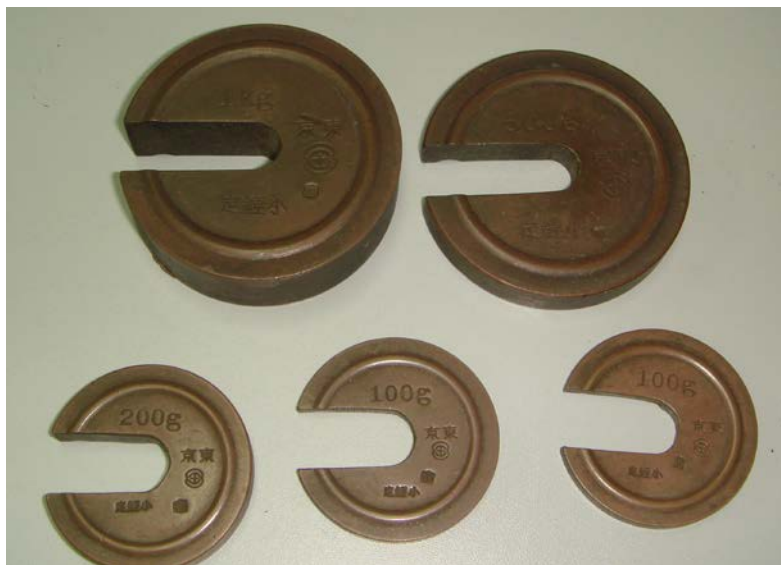
写真4 4種類、5個の分銅（1Kg1個、500g1個、200g1個、100g2個）、写真5が分銅の置き場と5個の分銅である。

この上皿棹秤には分銅が、100g用が2個、200g用が1個、500g用が1個、1Kg用が1個ついている（写真4）ので最大2Kgまで計れる。分銅を全く使わなければ、0～100g迄、100gの分銅を1個使えば100～200gが計れ、2個使えば200～300gが計れる。100gの分銅1個と200gの分銅1個を使えば300～400gが図れるというように、分銅を100gごとに増やしていけば、0～2000gまで1g単位ではかれる優れものなのである。