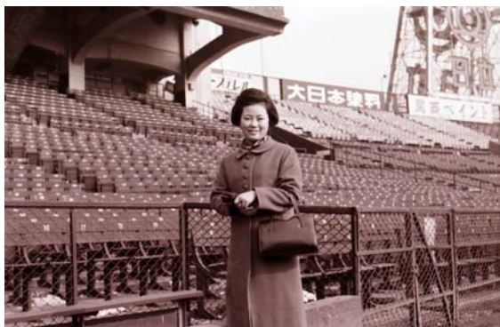
写真 10 応援に来た天文台の交換手さん