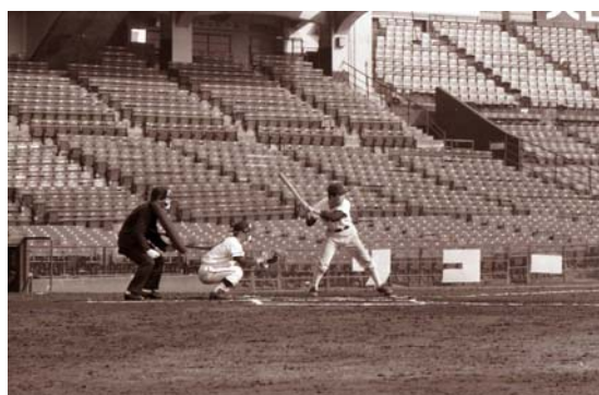
写真7 キャッチャーは筆者