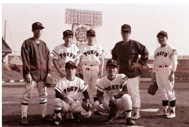
写真9 チームは事務部の人が多い