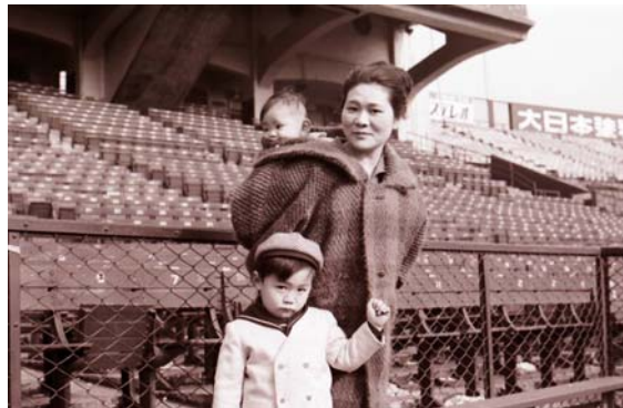
写真 11 はて、誰のご家族だろう