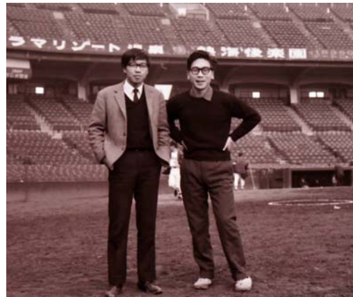
写真 13 ベンチに入れなかった！