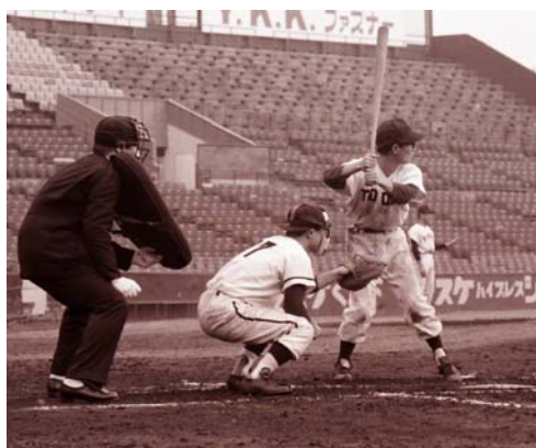
写真8 キャッチャーは筆者