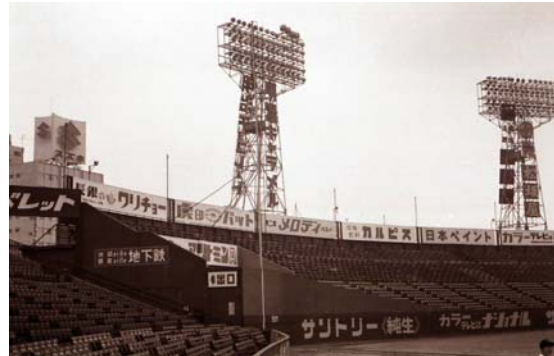
写真3 後樂園球場の照明塔