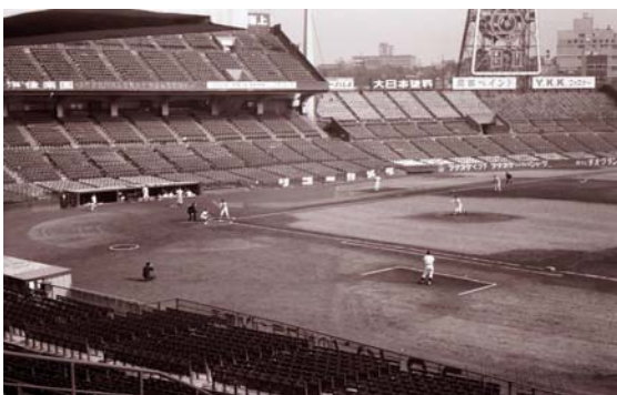
写真2 後樂園球場のダイヤモンド

写真1では、この球場が後樂園である証拠にはなりづらいので、何枚かその時の写真を載せてみよう。写真2、写真3でこの球場が後樂園球場ということが分かってもらえると思う。当然ながら、現在のドーム球場ではなく、屋根のない、そして人工芝でもない川上、長島、王が活躍した球場であった。