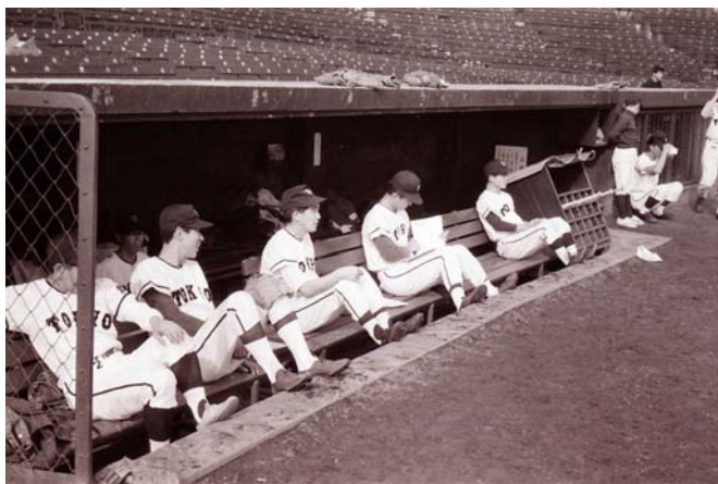
写真4 ベンチの天文台チーム