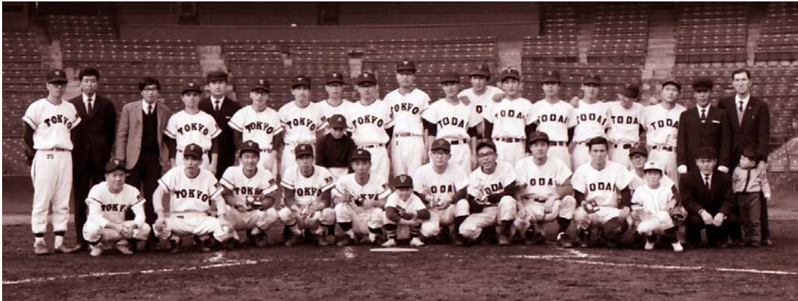
写真1 後樂園球場で天文台野球部と東大事務局チーム

東京天文台野球部は後樂園球場で試合をしたことが何度かある。1967年頃の事である。もう40年も前の事になる。古い写真をアーカイブするためスキャナーで取りこみ、デジタルデータとした中に古い野球部の写真がある。写真1はその記念写真の1枚である。TOKYOと入ったユニホームが東京天文台野球部、TODAIと入ったユニホームが東京大学事務局の庶務部(多分)である。そのころ、東大事務局は庶務部、経理部、施設部の3チームがあり、天文台野球部は天文台グラウンドでこれらのチームと何度も試合をしており、一度は憧れの後樂園球場でやりたいと実現させたものである。